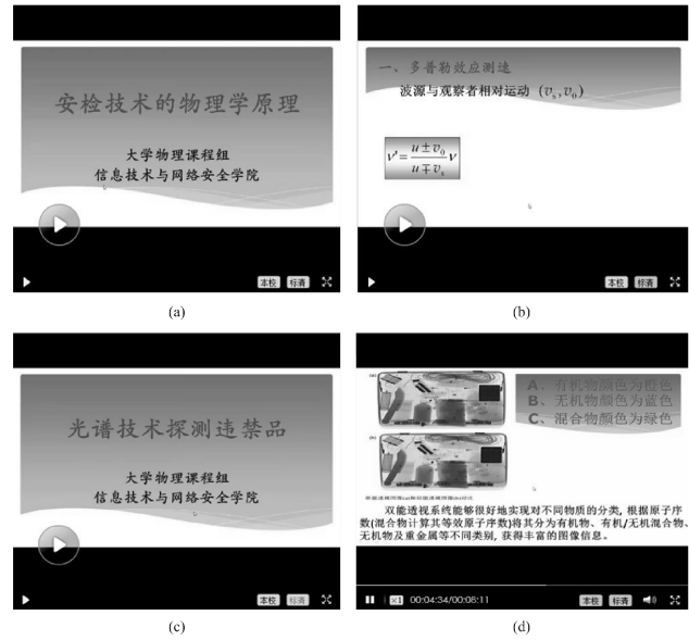
图6 物理学原理在公安技术的应用微课讲解视频

新一代大学生与信息技术的飞速发展相伴而生,多媒体信息技术已融入到他们的生活和学习中,也给传统教学模式带来深刻影响,改变了传统教学