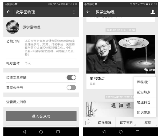
(a) 微学堂物理 (b) 自定义菜单界面

尽管网络教学平台资源丰富,但是其推送和提醒功能欠缺,在漫长的学习过程中,容易遗忘,这一点恰好可利用微信强大的推送功能来弥补。设计微信公众号“微学堂物理”,个性签名“仰望宇宙之浩瀚,洞悉量子之奥秘”,如图 1(a)所示,引导学生加入,其中自定义菜单设计界面如图 2 所示,三个一级菜单包括课程概况、教学材料和发现。一级菜单分别下设二级菜单,上述菜单为学生提供教学资料、课程学习安排和物理前沿热点等,例如,知识体系为学生推送章节的教学目标、重点、难点、预习安排、课堂讨论等,做到先学后教,提高学习的自主性。前沿热点可以推送宇宙的起源、黑洞、量子计算和信息及部分科学家介绍等等,如图 1(b)紧扣时代发展脉搏,激发学生对探索未知自然的热爱。根据教学安排,可随时给学生推送课程的学习动态、通知和教学要求等。此外,利用微信公众号的统计功能,查看推送资源的阅读次数和阅读人员,掌握学生学习的状态和主动性;利用自动回复功能可以和学生进行课程学习的交流互动,加强师生联系,及时了解学习情况,进行针对性的备课和授课。需要指出的是,一般的微课资源和实验操作演示都较大,这为直接加载视频带来了很大局限。因此考虑利用微信推送链接地址,通过阅读原文链接到网络平台的各种资源,下载到本地电脑或移动终端来学习和阅读。