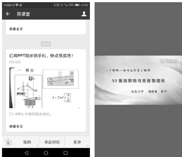
(a) 同步到手机 (b) 插入慕课视频 图 3 雨课堂 PPT

风采,如图 3(b) 所示.值得一提的是,我校一般采用合班上,后排的同学观看课件有难度,这种方式对于大班后排同学的授课效果较好.